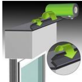
Bild 1: Band zweimal umklappen und innen bündig auf den Kasten kleben