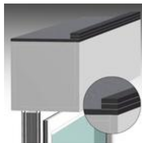
Bild 2: als Stufenband montieren