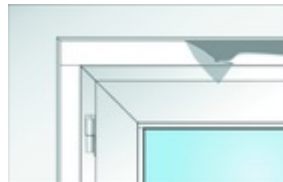
Bild4: Die Leisten werden stumpf gestoßen.