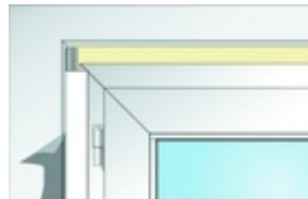
Bild 3: Die Eckverbindung wird mittels Ausbruch an einer Leiste hergestellt. Die zweite Leiste wird seitlich angesetzt.