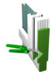
Bild 1: Abdichtung aussparen

Abdichtungsbeschichtung. SP351 kann nach Aushärtung des SP925 direkt auf die Abdichtungsbeschichtung appliziert werden.