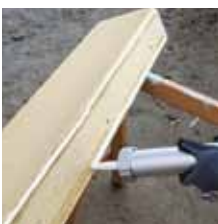
5. Aplikace lepidla SP340 na rám ve dvou housenkách.