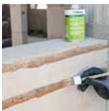
4. Příprava zdiva a penetrace.