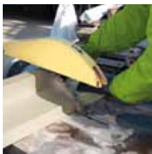
1. Příprava rámu.