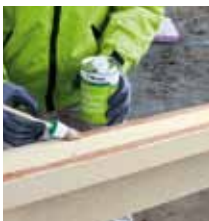
3. Příprava lepených ploch podkladním nátěrem nátěrem illbruck AT140.