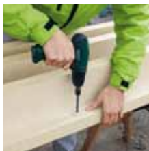
2. Předvrtání otvorů pro pojistné šrouby.