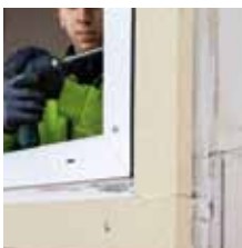
8. Upevnění okenního rámu pomocí okenních šroubů. Utěsnění připojovací spáry komprimační páskou TP654 illmod Trio 1050.