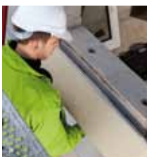
6. Instalace L profilu PR010 na zdivo.