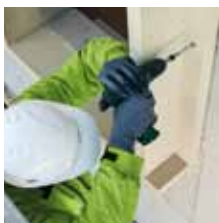
7. Zajištění absolutního přitlaku profilů ke zdivu pomocí pojistných šroubů.