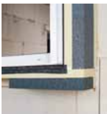
9. Aplikace hydroizolační fólie illbruck proti tlakové vodě a izolačních klínů PR012.