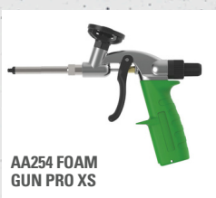
AA254 FOAM GUN PRO XS