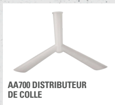
AA700 DISTRIBUTEUR DE COLLE