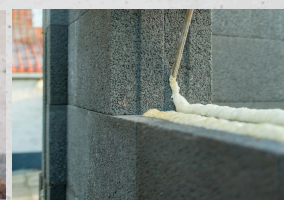
béton (d'une grande précision dimensionnelle)