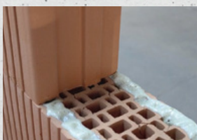
blocs à coller calibrés céramiques (briques creuses)