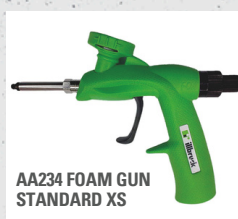
AA234 FOAM GUN STANDARD XS