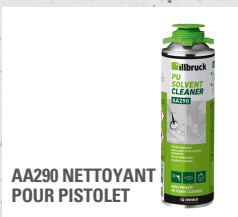
AA290 NETTOYANT POUR PISTOLET